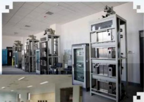
智能电梯安装调试维护训练场所